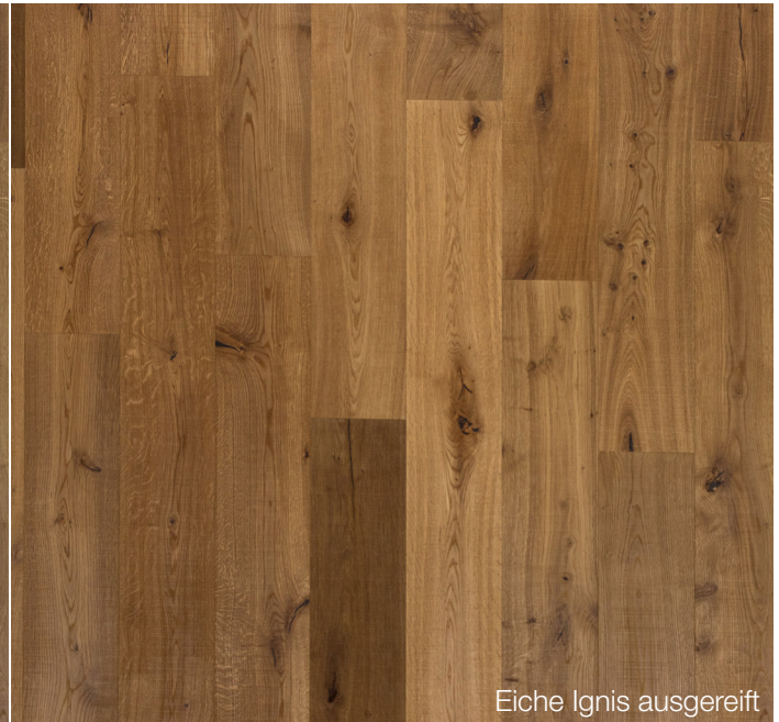
Eiche Ignis ausgereift