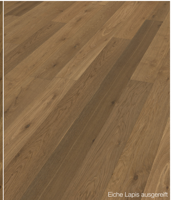
Eiche Lapis ausgereift

Admonter ist ein 100%-iges Naturprodukt. Ein Foto kann daher nie das Original widerspiegeln. Deshalb empfehlen wir eine Beratung an Hand von Musterplatten.