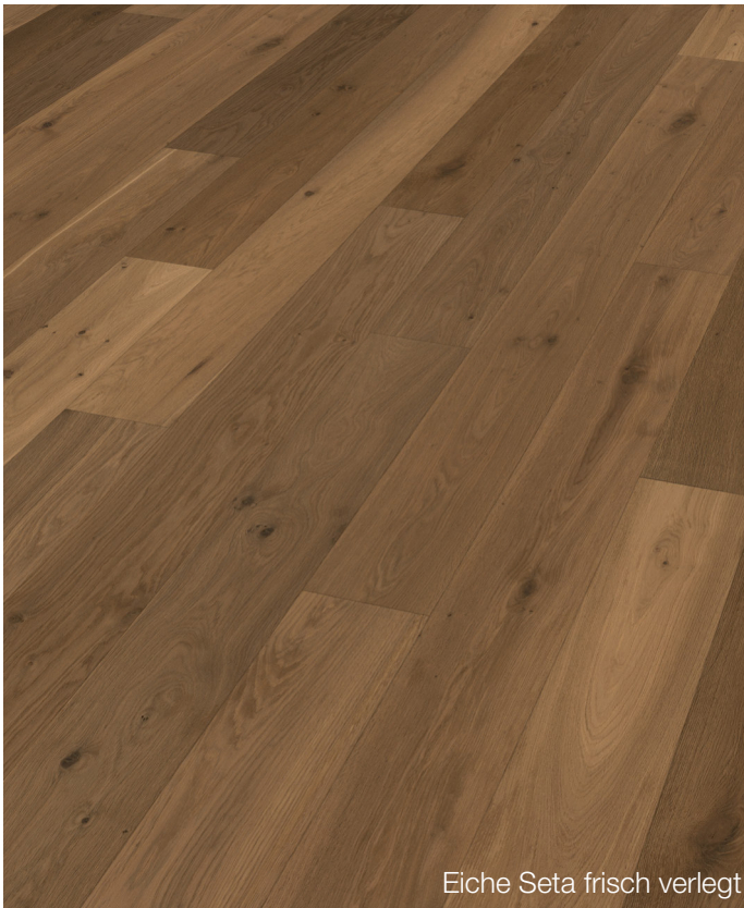
Eiche Seta frisch verlegt