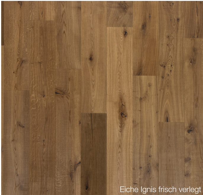
Eiche Ignis frisch verlegt