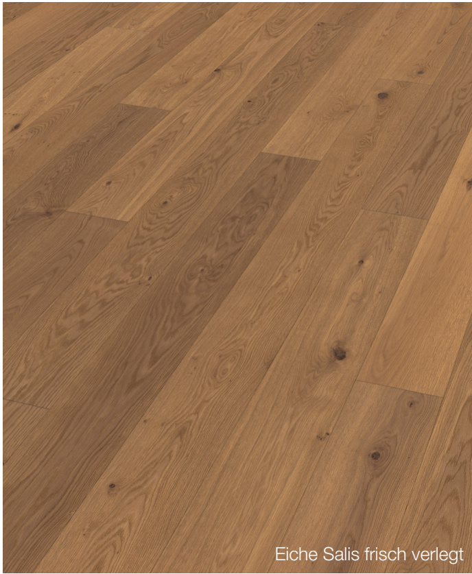
Eiche Salis frisch verlegt