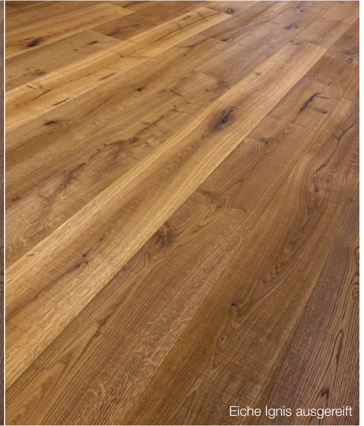
Eiche Ignis ausgereift