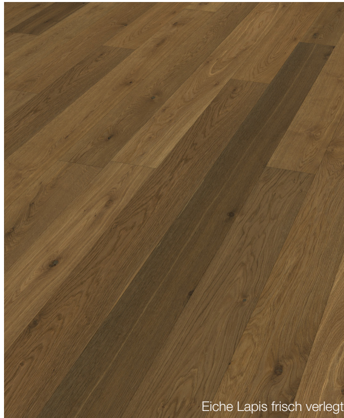
Eiche Lapis frisch verlegt