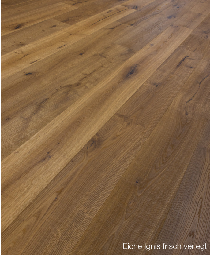
Eiche Ignis frisch verlegt