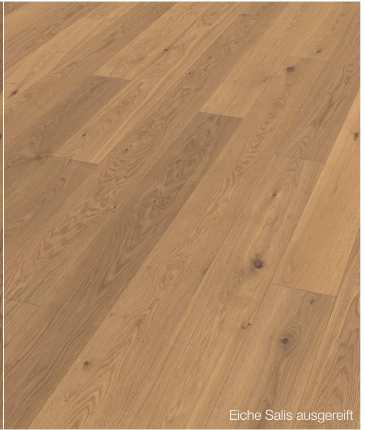
Eiche Salis ausgereift