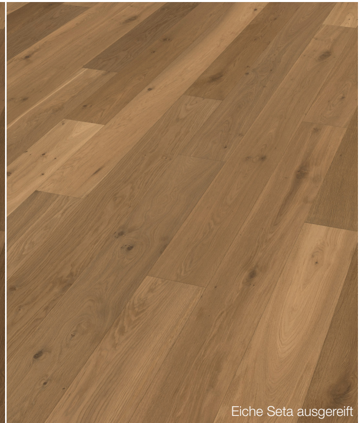
Eiche Seta ausgereift

Admonter ist ein 100%-iges Naturprodukt. Ein Foto kann daher nie das Original widerspiegeln. Deshalb empfehlen wir eine Beratung an Hand von Musterplatten.